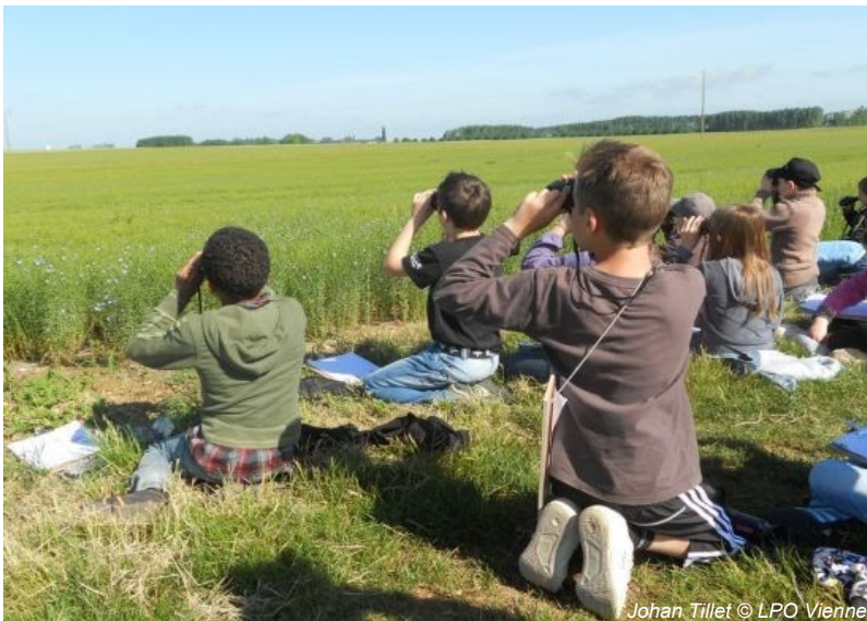
Johan Tillet © LPO Vienne

Vous, les collectifs régionaux, pouvez contribuer à développer cet indicateur en faisant connaître les programmes de votre région, comme par exemple en Pays de Loire et Nord-Pas de Calais . Y en a-t-il d'autres que nous ne connaissons pas ? Signalez vous !